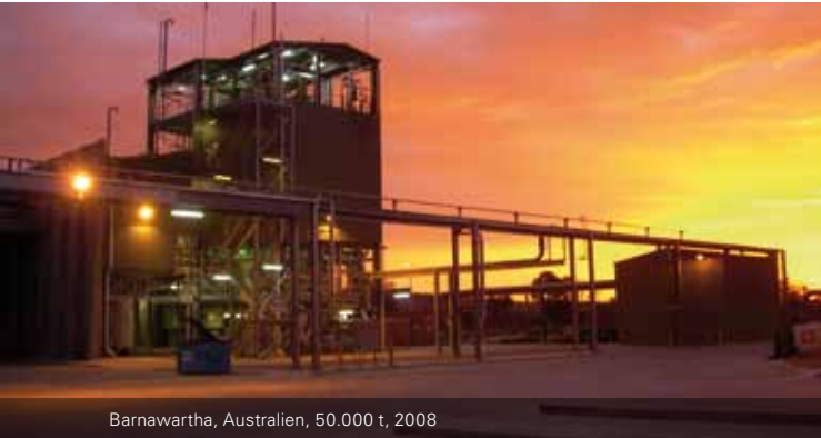
Barnawartha, Australien, 50.000 t, 2008