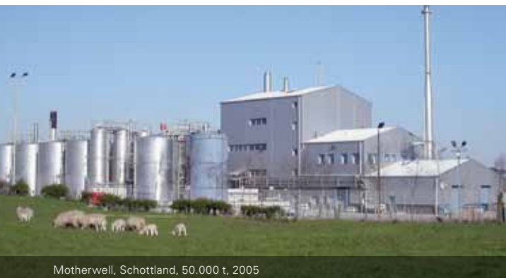
Motherwell, Schottland, 50.000 t, 2005

Regel 53 und 54: Die Mehrheit der Mitglieder des Aufsichtsrats ist nicht als unabhängig anzusehen. Sie sind jedoch als langjährige Berater der Gesellschaft wichtige