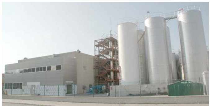
Multi-Feedstock-Anlage in Barcelona, Spanien

Im Bereich von Multi-Feedstock-Anlagen, also von Anlagen, die auf Basis unterschiedlicher Rohstoffe BioDiesel produzieren können, sind wir weltweit Technologie- und Marktführer. Das Rohstoffspektrum für unsere Multi-Feedstock-Anlagen ist groß und reicht von frischen Pflanzenölen bis zu Reststoffen oder Nebenprodukten aus anderen Produktionsprozessen wie Alt Speiseöl und tierischen Fetten. Vor allem aber macht es unsere Multi-Feedstock-Technologie möglich, ausschließlich auf kostengünstiges Alt Speiseöl oder Tierfett als Rohstoff zur Produktion von BioDiesel der höchsten Qualitätsnorm EN 14214 zurückzugreifen. Dies ist ein entscheidender Kosten- und damit Wettbewerbsvorteil. Denn die Rohstoffkosten sind der mit Abstand wichtigste Kostenfaktor bei der Biodieselproduktion. Das von BDI entwickelte Multi-Feedstock-Verfahren ist auch als erstes und bislang einziges von der Europäischen Union zur Verarbeitung von Kategorie 1 Fetten (sogenannten „Risikofetten“) zugelassen worden.